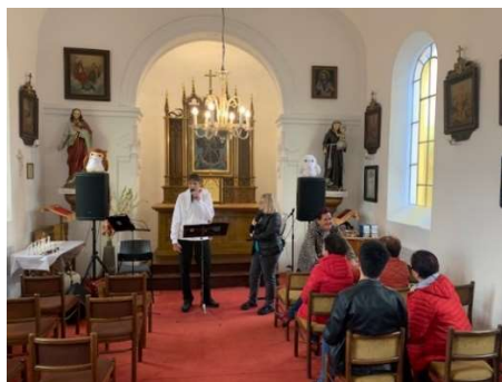
2.11. Požehnání oltáře v Mokřém