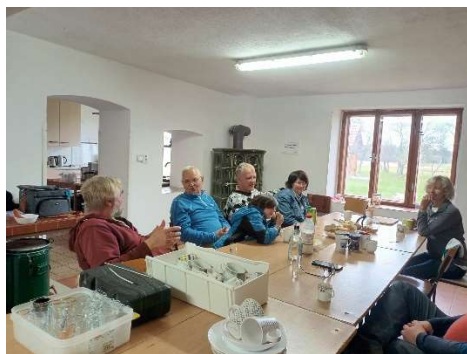
2.11. Poslední letošní brigáda na Tampíru