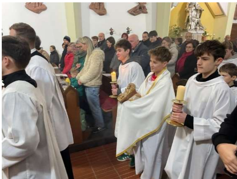
24.12. Vánoční vigílie pro děti