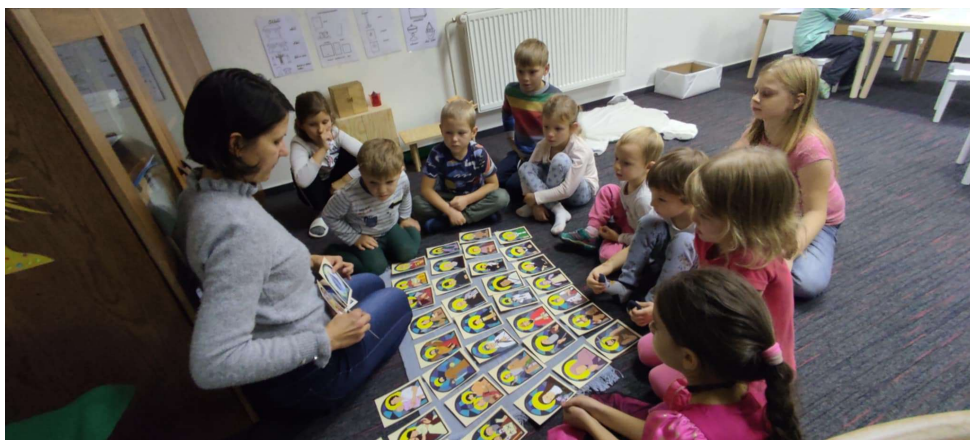
21.11. Biblická školička