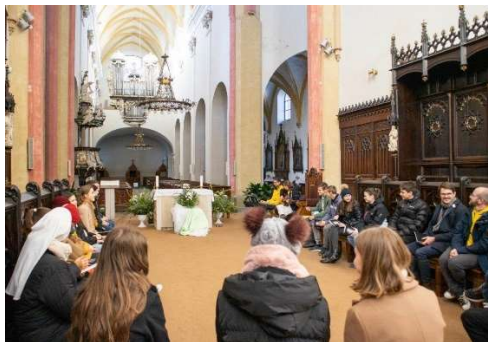
26.11. Vikariální setkání mládeže