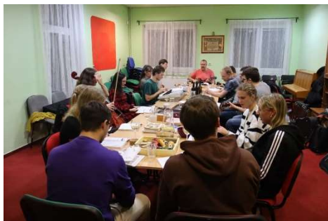
12.11. Úterky u sv. Vojtěcha