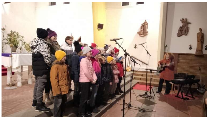
3.12. Adventní koncert