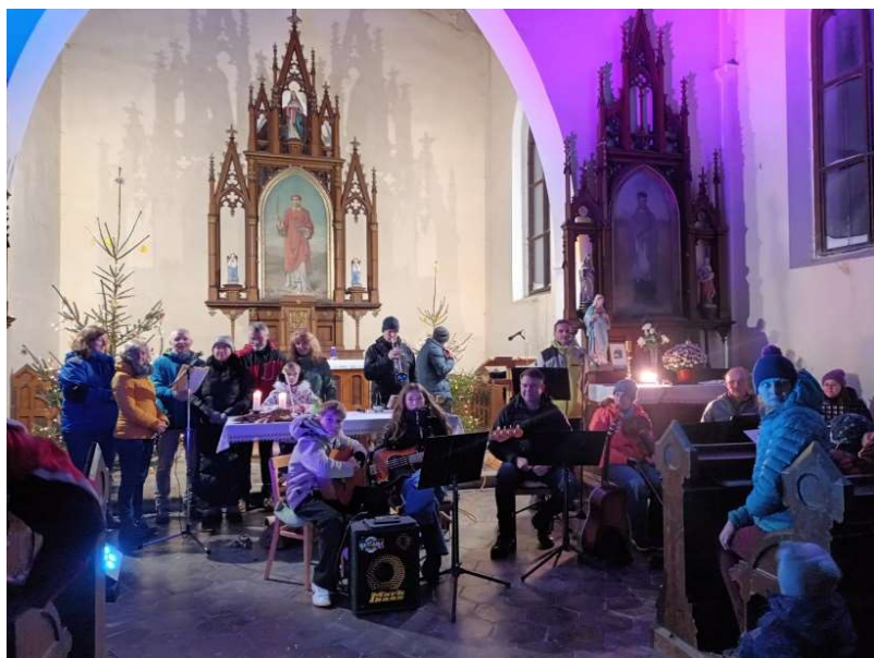
28.12. Zpívání koled na Kvildě