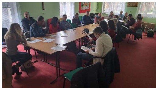
17.11. Workshop k lektorské službě