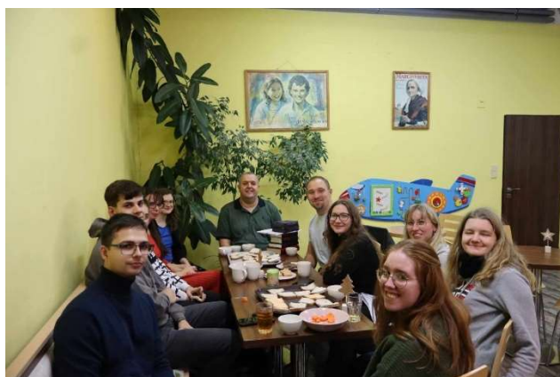
17.12. Vysokoškoláci zakončili svůj zimní program na Čtyráku