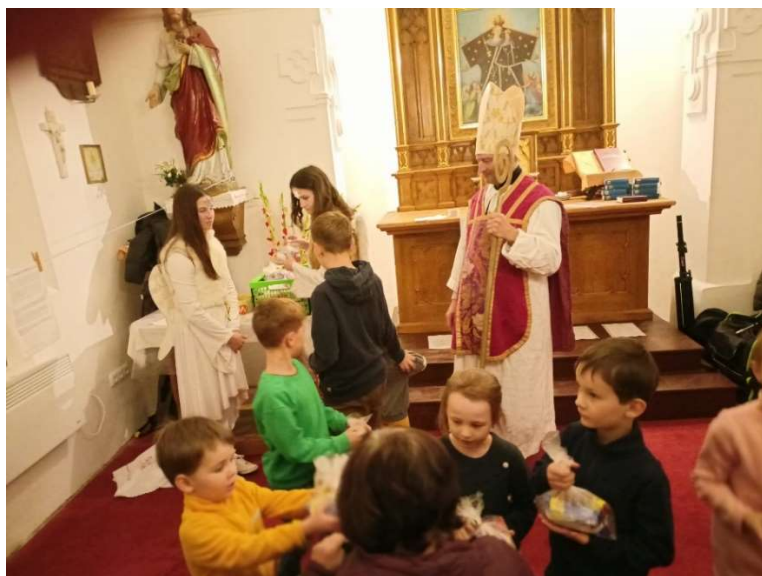
6.12. Mikuláš v Mokrém