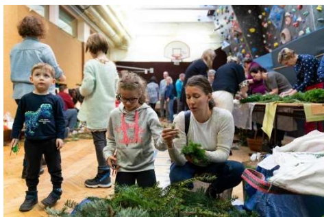
30.11. Adventní věnce