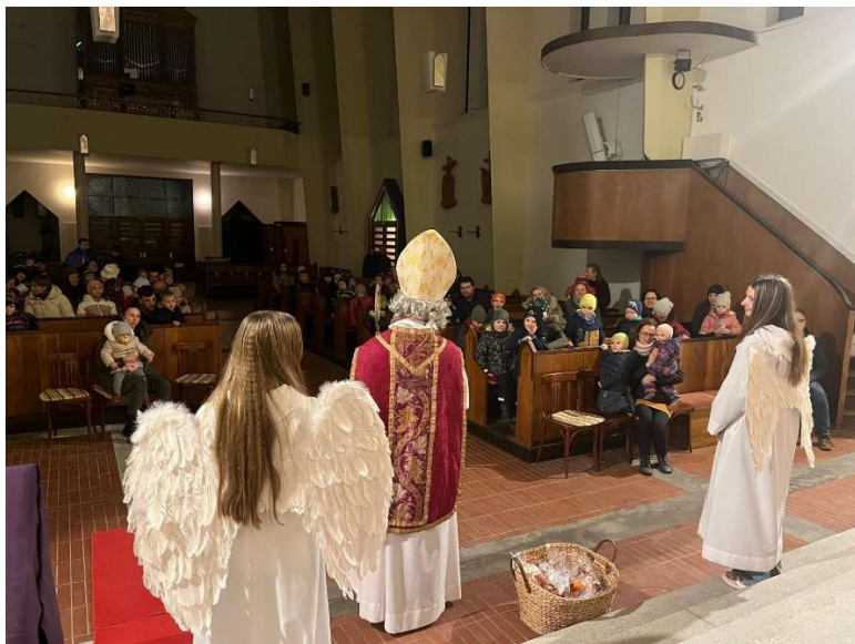
5.12. Mikulášská besídka