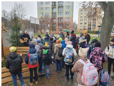
12.12. Programy pro školy o Vánocích